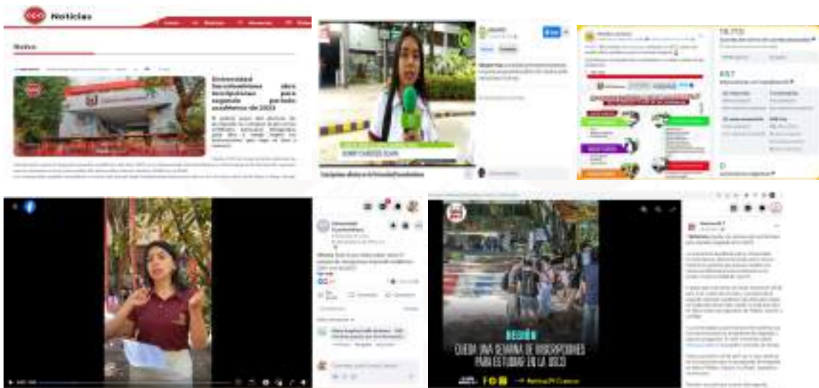
Figura 16. Promoción de la oferta académica institucional en redes sociales

Adicionalmente, de manera eventual se pautó en medios de comunicación externos, para promocionar los programas de pregrado de la institución en el marco de las inscripciones abiertas.