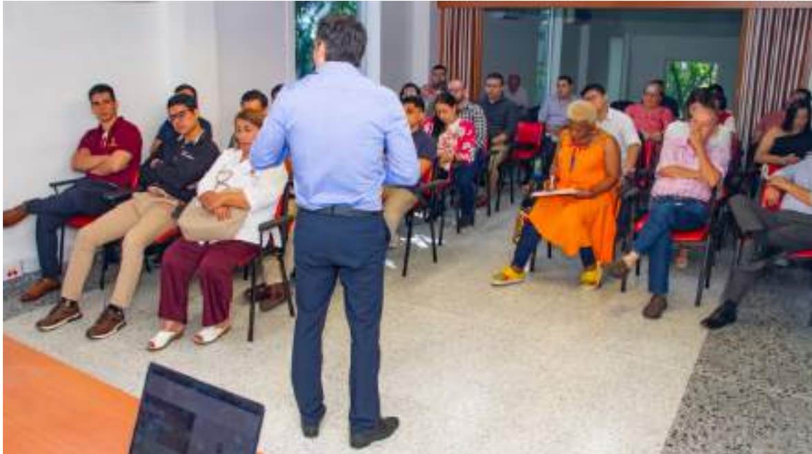
Figura 31. Socialización del Documento por parte del equipo consultor de la UAO

buenas prácticas y la experiencia de la Universidad Autónoma de Occidente. Como parte de este proceso se socializó en el mes de diciembre a la comunidad académica el documento denominado “Orientaciones para el despliegue de la mediación digital en las modalidades de la Universidad Surcolombiana”.