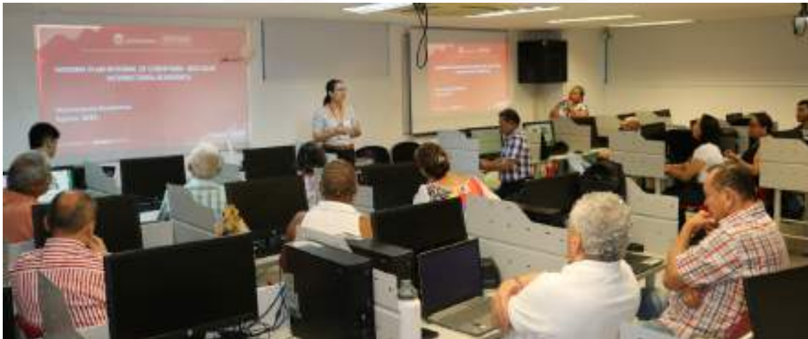
Figura 2. Socialización de la ruta para la formación virtual

Este proceso ha incluido igualmente, la capacitación en estrategias pedagógicas para la virtualidad del personal docente a través de la extinta Escuela de Formación Pedagógica.