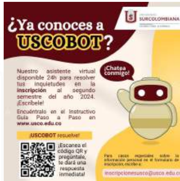
Figura 4. Lanzamiento Uscobot

El equipo de trabajo del proyecto de Oferta Académica Institucional de la Vicerrectoría Académica, en coordinación con el Centro de Información, Tecnologías y Control Documental, implementó un nuevo recurso digital para mejorar la comunicación con las partes interesadas y los aspirantes a estudiar en los programas de la Universidad Surcolombiana. Dicho recurso se denomina “Uscobot” lanzado en el periodo académico 2024-2, el cual permite resolver inquietudes de todo el proceso de admisiones.