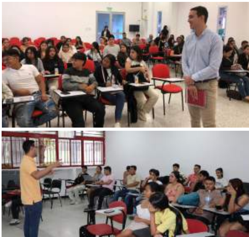
Figura 9. Socialización de talleres de Teleología Institucional