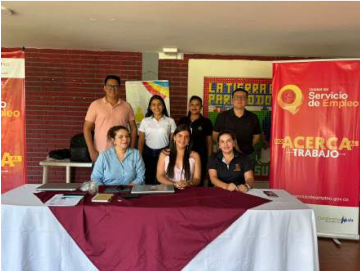
Figura 34. Realización de Ruedas Laborales en las sedes regionales