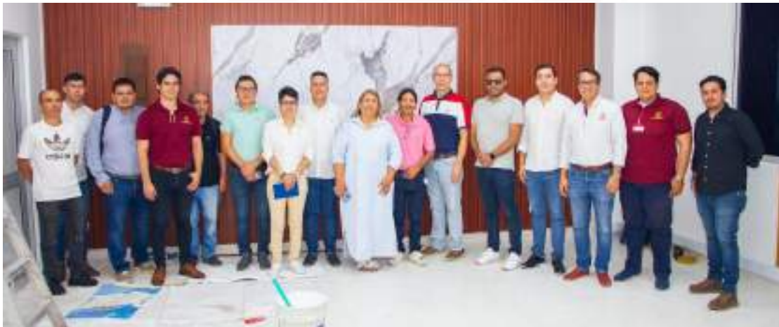
Figura 27. Equipo del Proyecto de Investigación de Aulas Híbridas con enfoque en inglés

Además, se contó con la consecución de los recursos necesarios para modernización de la planta física adaptada a las nuevas tecnologías para la implementación de la primera Aula Híbrida de la Universidad con recursos del Sistema General de Regalías para el fomento del uso TIC en el Aula y recursos mediados.