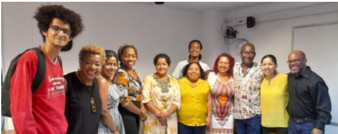
Figura 24. Actividades de la Escuela de Formación Pedagógica