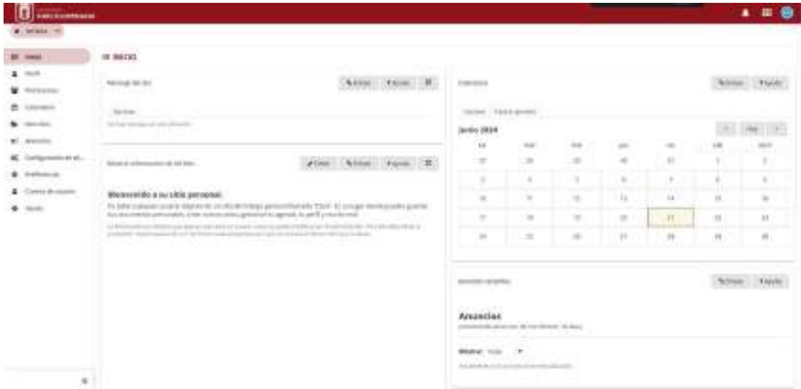
Figura 28. Actualización de la interfaz gráfica y funcionalidad del LCMS Sakai

dispositivos móviles, lo que facilita el acceso desde teléfonos y tablets. También incluye mejoras en accesibilidad, ofreciendo una experiencia de usuario más eficiente y accesible para todos.