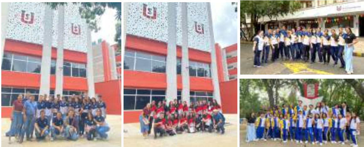
Figura 15. Promoción de la oferta académica institucional - Visita la Usco

Finalmente, en una de las salas de cómputo de la Facultad de Economía y Administración, se aplica la Prueba de Orientación Profesional y se realiza el ejercicio de ponderados con el Simulador de Ponderaciones USCO, finalizando así un agradable encuentro de los próximos bachilleres con la Universidad.