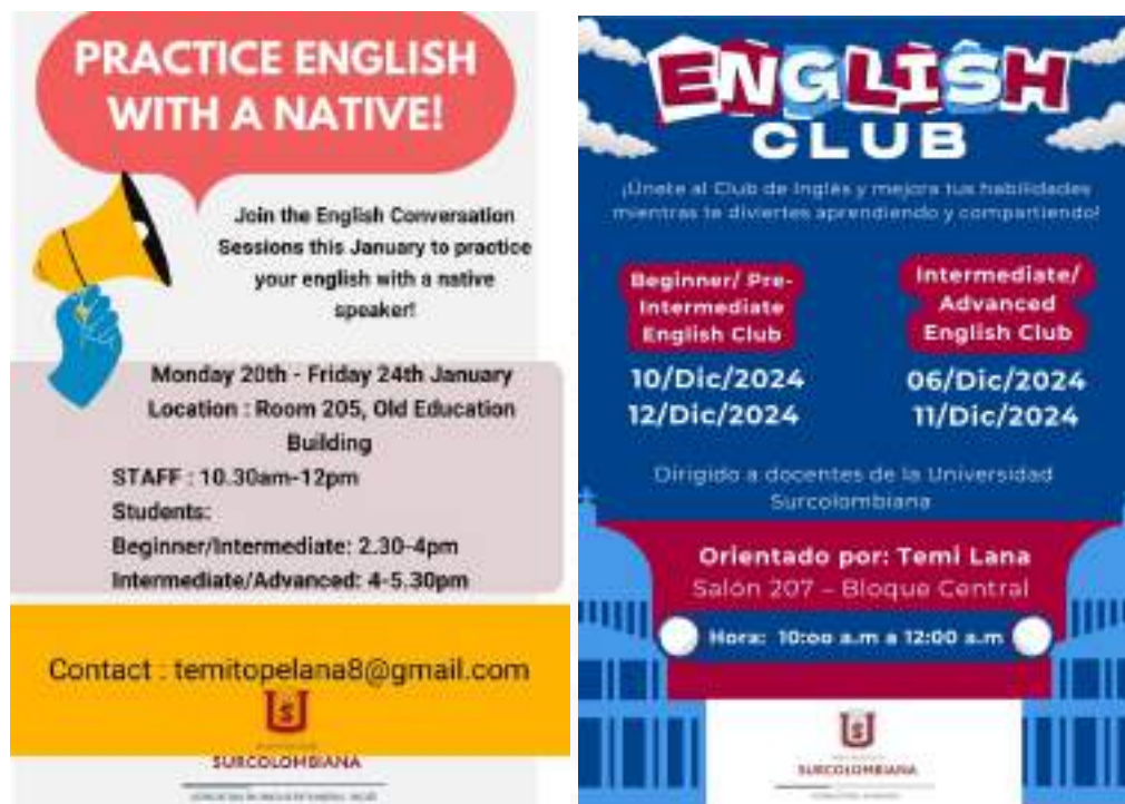
Figura 23. Actividades de capacitación en lengua extranjera

temas de conversación amplios que permiten fluir la conversación desde el conocimiento previo. La imagen describe los temas abordados durante los meses de enero y diciembre de 2024 con participación de docentes y estudiantes, especialmente durante el periodo intersemestral.