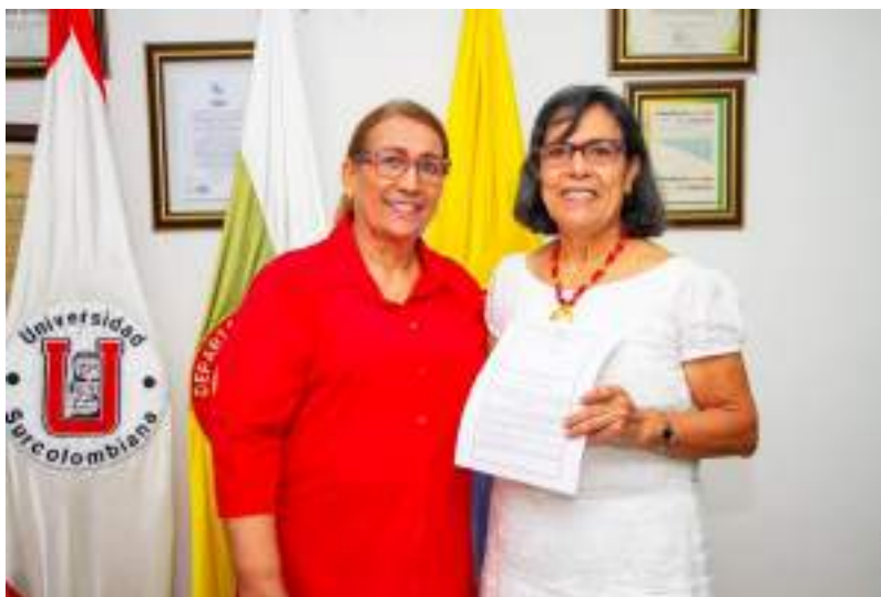
Figura 32. Renovación de Registro Calificado - Especialización en salud familiar