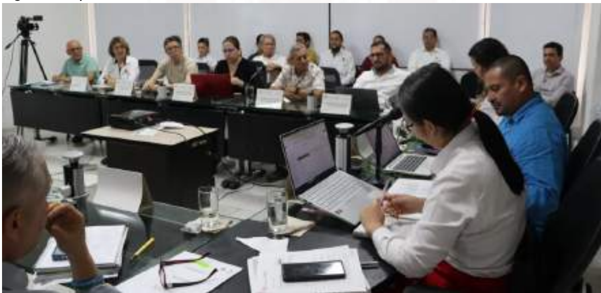
Figura 8. Aprobación del Plan de Desarrollo Institucional