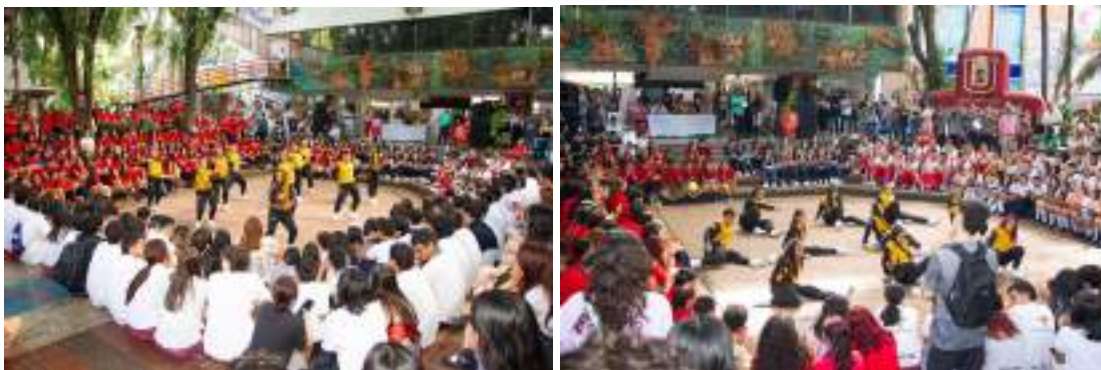
Figura 18. Feria de la Surcolombianidad