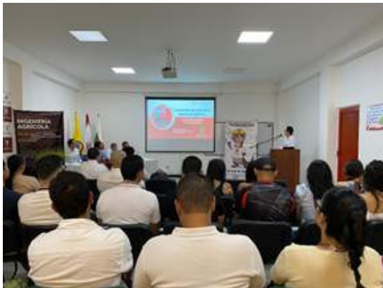
Figura 35. Realización de Encuentros de graduados en las sedes regionales

En lo correspondiente a los encuentros de graduados adelantados por esta dependencia, el pasado 06 de septiembre del año 2024, se realizó el encuentro de graduados del programa de Ingeniería Agrícola en la sede regional Garzón. El evento contó con la participación de 40 graduados y se desarrolló en dos momentos; la primera de horario de 1pm a 5:30 pm en el auditorio de la respectiva sede y en el cual se abordaron las temáticas relacionadas con el proceso de la autoevaluación para la renovación del registro calificado de los programas ofertados en este municipio, y en un segundo momento, se realizó una recepción social en el marco del encuentro para compartir un espacio con los invitados al evento.