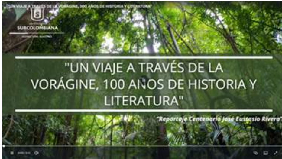
Figura 11. Presentación del reportaje “Un viaje a través de la Vorágine, 100 años de Historia y Literatura”