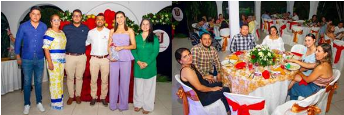
Figura 36. Realización de Encuentros de graduados en la sede Neiva

De igual forma para la sede central de Neiva, durante el mes de Noviembre se realizó todo lo pertinente para el encuentro institucional de graduados. Mediante convocatoria publicada a través de los canales oficiales, redes sociales y con el apoyo del equipo de la oficina de graduados, se visibilizó el respectivo evento. Participaron alrededor de 130 graduados de las diferentes facultades de la Universidad Surcolombiana.