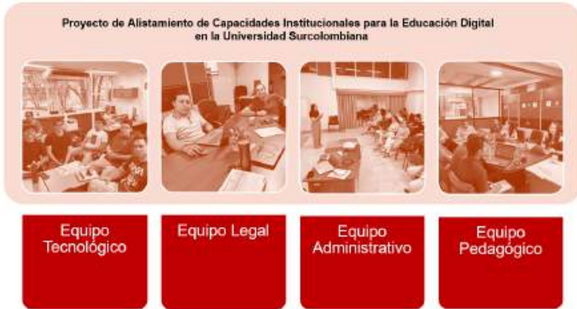
Figura 25. Conformación de equipos del Proyecto de Alistamiento

de la Educación Digital en la Universidad. Además, se contó dos delegados docentes por facultad para una mejor sinergia de trabajo y necesidades académicas de este proyecto.