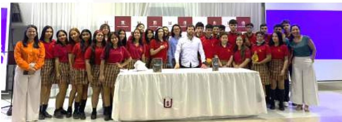
Figura 6. Participación de Instituciones Educativas en los actos conmemorativos