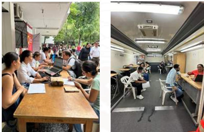
Figura 33. Realización de Ruedas Laborales

Por otro lado, para potencializar el programa de bolsa de empleo en materia de empleadores y ofertas laborales, durante el primer semestre del año 2024, se llevaron a cabo las respectivas ruedas laborales. El 07 de marzo de 2024 se llevó a cabo en la sede Central, la primera rueda laboral del año en articulación con las Agencias Públicas del SENA y el CONFAMILIAR.