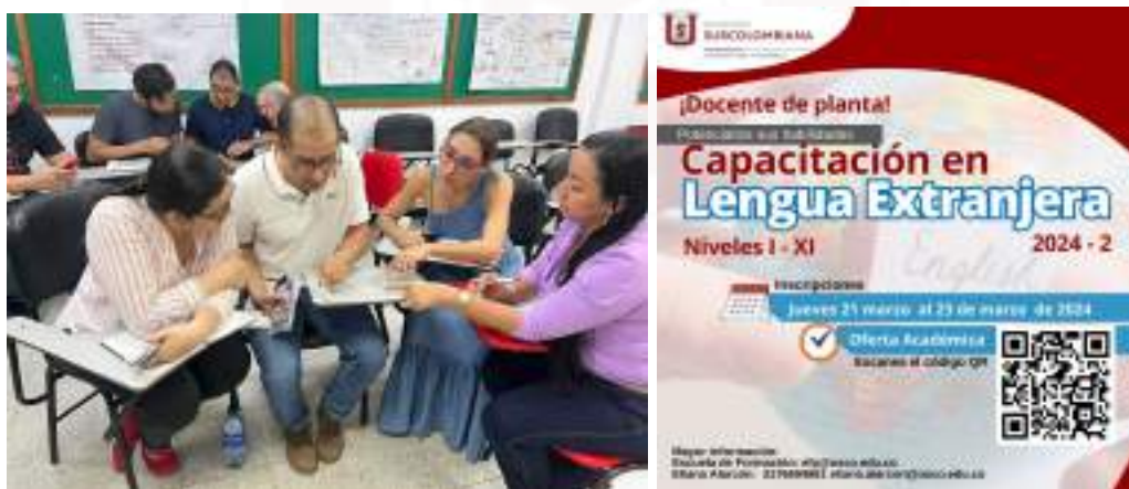
Figura 22. Actividades de formación en lengua extranjera

Uno de los énfasis que realiza la institución para el desarrollo profesoral, hace referencia a la cualificación y promoción de los docentes para el desarrollo de un segundo idioma en el respectivo estamento. En el transcurso del año 2024, tres veces por semana, alrededor de 72 docentes asistieron a clases según su nivel: Básico (A1), Pre-Intermedio (A2), Intermedio (B1), Avanzado (B2 y C2), permitiendo así fortalecer la capacidad de los docentes en el desarrollo de habilidades sus lingüísticas.