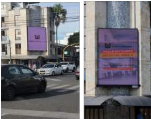
Figura 17. Promoción de la oferta académica en vallas publicitarias