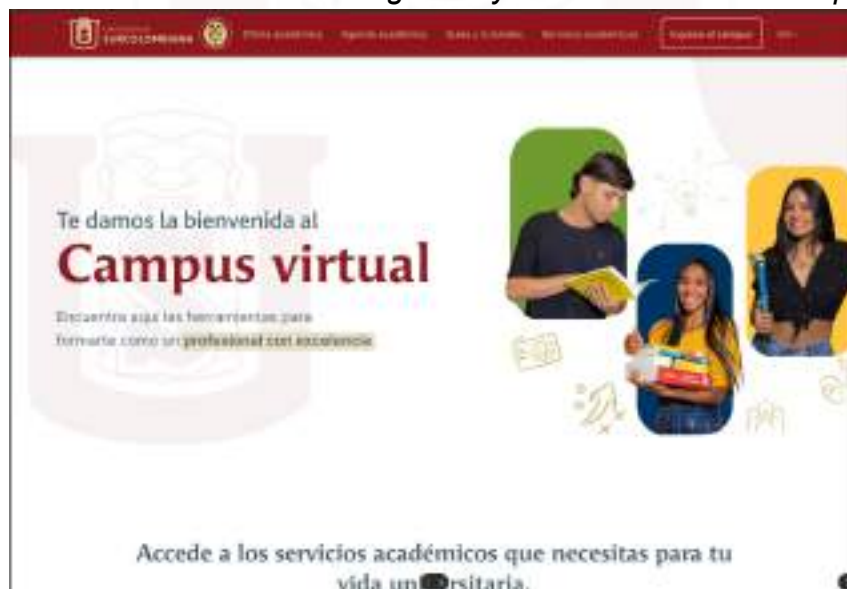
Figura 29. Actualización de la interfaz gráfica y funcionalidad del Campus Virtual

Adicionalmente, a la actualización de la versión v21 de Sakai se realizaron los ajustes necesarios para una mejora de usabilidad de los servicios educativos, de investigación y de bienestar universitario del Campus Virtual de la Universidad.