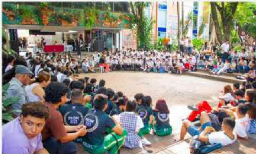
Figura 3. Feria de la Surcolombianidad

Durante el primer semestre de la vigencia 2024, a solicitud de las partes interesadas y de la comunidad universitaria, la Vicerrectoría Académica coadyuvó en la elaboración de un proyecto normativo cuyo fin fue el de establecer un valor más justo de la inscripción para aspirantes a los programas de pregrado en la Universidad Surcolombiana. Dicho procedimiento tuvo al Consejo Superior Universitario como máxima instancia para su discusión y aprobación en el marco de sus competencias y funciones.