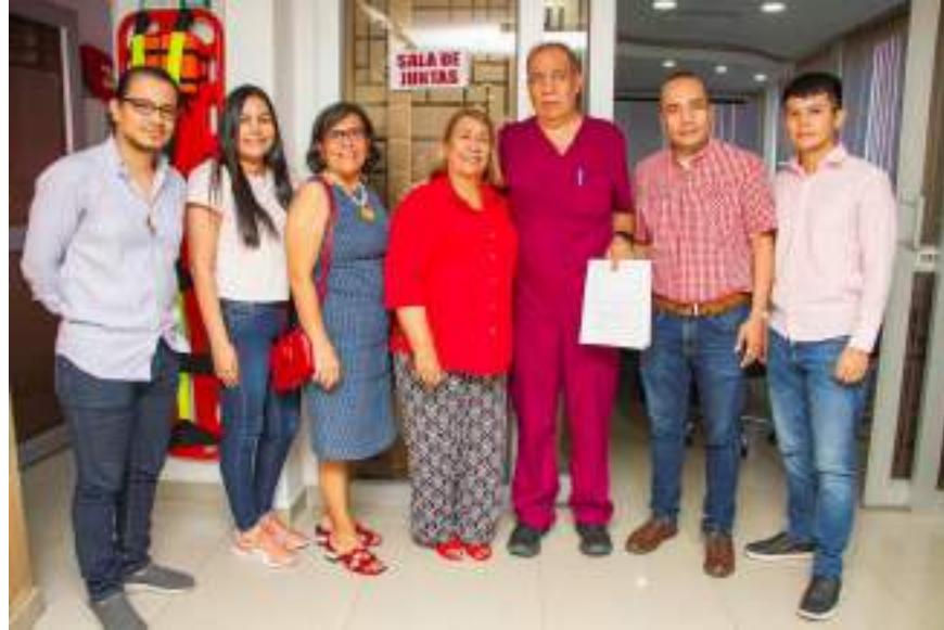
Figura 13. Presentación del registro calificado del nuevo programa de Doctorado en Derecho Constitucional