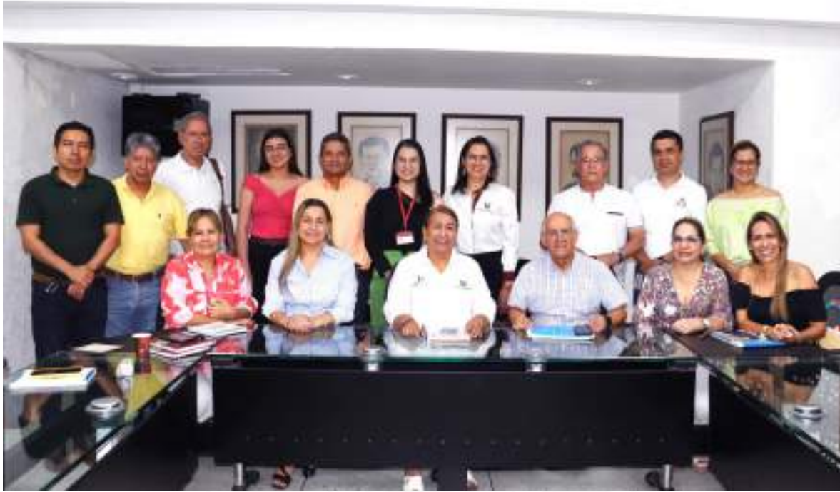
Figura 7. Desarrollo del taller con actores sociales y gremios de la producción

de los datos obtenidos a partir de los diferentes grupos focales consultados para la construcción del PDI 2025-2034.