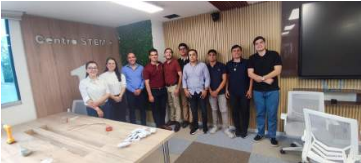
Figura 26. Seguimiento a la construcción del Centro STEM+ 1 en Neiva.