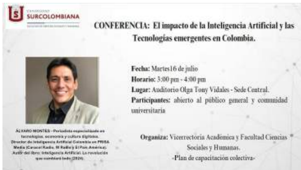
Figura 21. Actividades de capacitación colectiva