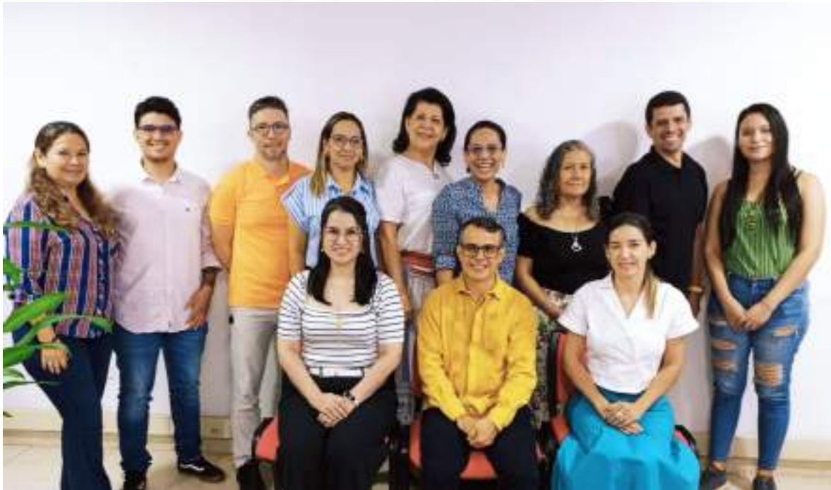
Figura 1. Comité Central de Currículo

Luego de su respectiva socialización y discusión, el 19 de junio de 2024, el Consejo Superior Universitario aprobó el Acuerdo número 033 “Por el cual se expide la Política Curricular de la Universidad Surcolombiana” , que incluye los lineamientos básicos sobre estructura curricular, modalidades educativas, ciclos propedéuticos y se alinea con el Marco Nacional de Cualificaciones.