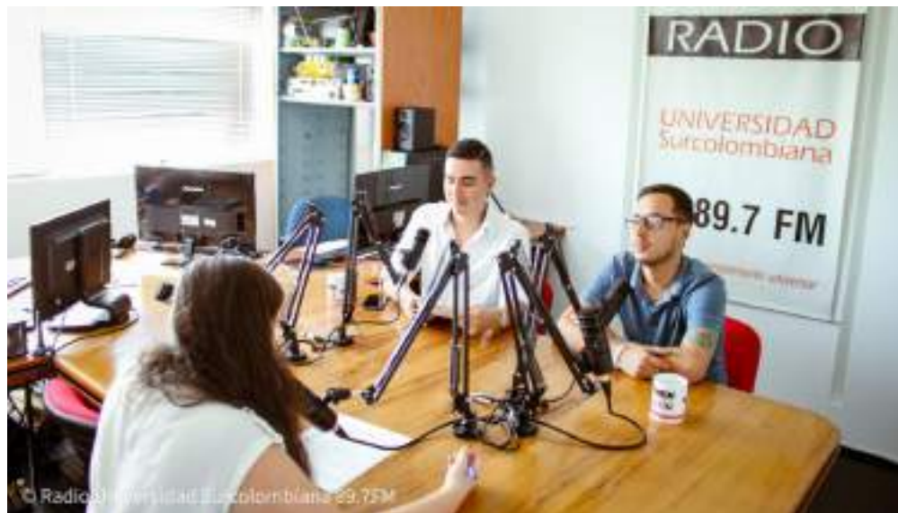
Figura 10. Socialización de Teleología Institucional en la Emisora Radio Universidad Surcolombiana