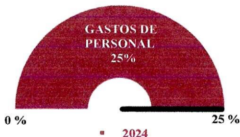
Gráfico No. 7