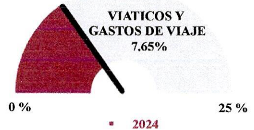
Gráfico No. 2

En la descripción de este concepto se detalló por acumulado de grupos según reporte 025 los viáticos y gastos de viajes, en el corte ya mencionado se ha ejecutado el 7.65% frente al 25% esperado del valor ejecutado en el año 2023.