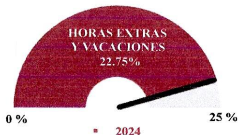
Gráfico No. 8