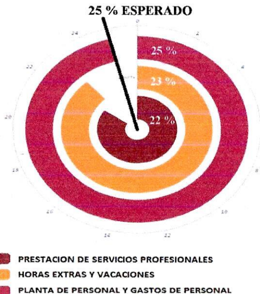
Gráfico No. 6

Los conceptos asociados a Gastos de Personal están diferenciados por ser servicios personales, los cuales se distinguen por la naturaleza jurídica/contractual; el personal de planta por nómina y de los colaboradores vinculados en la modalidad de prestación de servicios para los servicios profesionales por honorarios y de apoyo a la gestión.