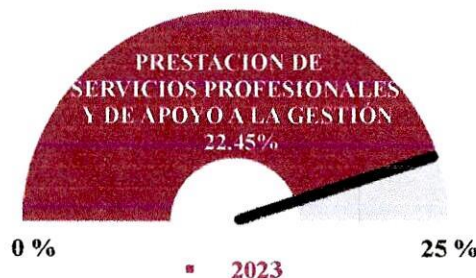
Gráfico No. 9

Al cotejar la información generada en el reporte 025 del sistema LINIX se refleja una variación del 22.45 % en el gasto del periodo con corte a 31 de marzo de 2024 por Prestación de Servicios Profesionales y de Apoyo a la Gestión frente a un 25% esperado en el mismo concepto para la vigencia 2023.