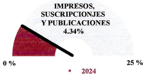
Gráfico No. 3