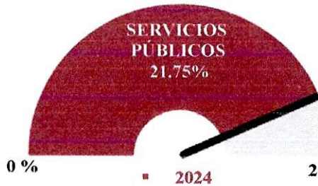
Gráfica No. 5

Este primer trimestre de la vigencia 2024 se evidencia un 21.75% en el gasto de servicios públicos frente a un 25% esperado; siendo la energía eléctrica el valor más relevante dentro de este rubro; por un valor de Seiscientos dieciséis millones quinientos noventa y cinco mil setecientos cuarenta y nueve pesos mcte. ($616.595.749). Siendo posiblemente afectado por la variación tarifaria que enfrenta el departamento.