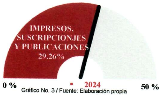
Gráfico No. 3