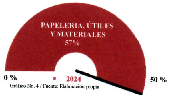
Gráfico No. 4