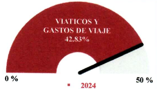
Gráfico No. 2

En la descripción de este concepto se detalló por acumulado de grupos según reporte 025 los viáticos y gastos de viajes, en el corte ya mencionado se ha ejecutado el 42.83% frente al 50% esperado del valor ejecutado en el año 2023.