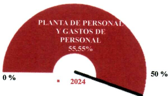
Gráfico No. 7