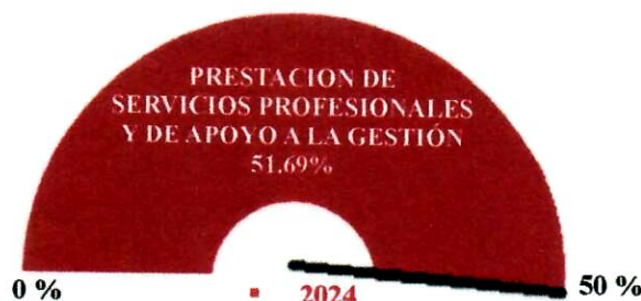
Gráfico No. 9

Al cotejar la información generada en el reporte 025 del sistema LINIX se refleja una variación acumulada del 51.69 % en el gasto del periodo con corte a 30 de junio de 2024 por Prestación de Servicios Profesionales y de Apoyo a la Gestión frente a un 50% esperado en el mismo concepto para la vigencia 2023; ubicándose dentro de un rango usual.