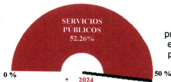
Gráfica No. 5

Este segundo trimestre de la vigencia 2024 se evidencia un 52.26% en el gasto de servicios públicos frente a un 50% esperado; siendo la energía eléctrica el valor más relevante dentro de este rubro; por un valor acumulado a 30 de junio de 2024 de Mil cuatrocientos noventa y cuatro millones trescientos veintiún mil doscientos setenta y un peso mcte. ($1.494.321.271) .