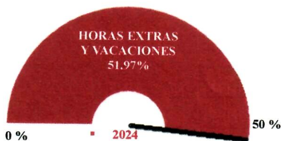
Gráfico No. 8