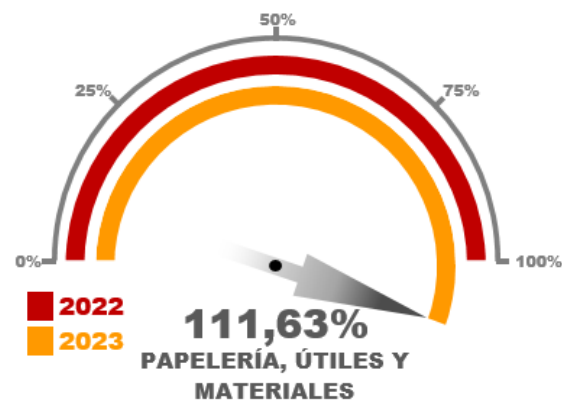
Gráfico No. 04