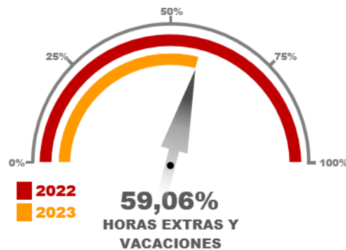
Gráfico No. 08