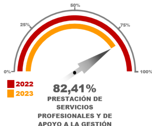
Gráfico No. 09

En el análisis del gasto por Prestación de Servicios Profesionales y de Apoyo a la Gestión, se detalló por grupos según se acumulan en el Reporte 025, en el que se observó que en general los gastos se han ejecutado en 82,41% al corte acumulativo del 30 de septiembre de 2023 frente al total del mismo concepto en la anterior vigencia 2022.