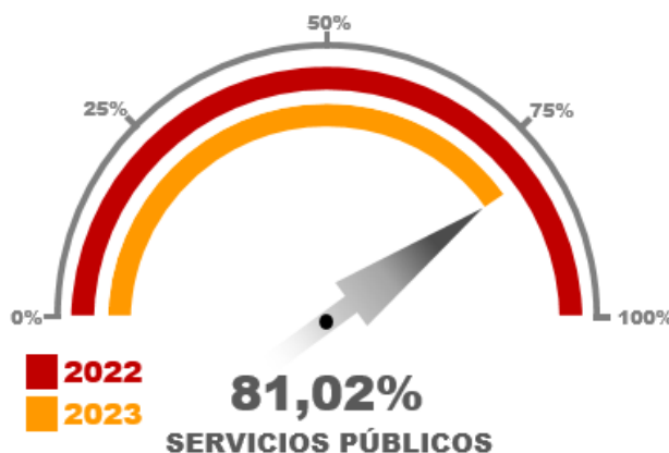
Gráfico No. 05

El ítem más representativo se denomina "Energía Eléctrica" por valor de mil quinientos ochenta y nueve millones setecientos noventa y nueve mil trescientos ocho pesos M/c. ($ 1.589.799.308 COP) con variación porcentual de 81,02% frente al total gastado en 2022.