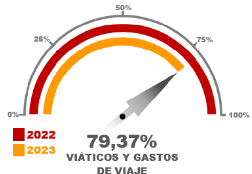
Gráfico No. 02 / Fuente, Elaboración Propia

Para la descripción de este concepto, se detalló por grupos según se acumulan en el Reporte 025 los viáticos y gastos de viaje, en el mencionado corte se ha ejecutado 79,37% frente al valor total ejecutado en el año 2022.