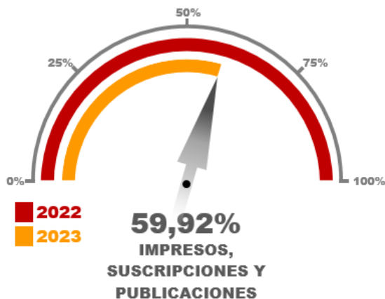
Gráfico No. 03

Para los Gastos denominados “Impresos, Suscripciones y Publicaciones”, se logró observar que el consumo fue relativamente bajo al corte del 30 de septiembre de 2023, pues el porcentaje esperado según la referencia era del 75% sobre la vigencia 2022 y se obtuvo solo el 59.92%.