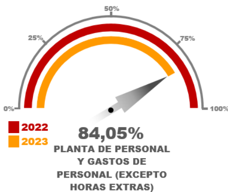
Gráfico No. 07