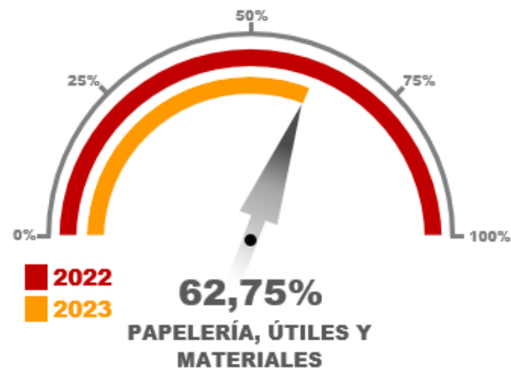
Gráfico No. 04