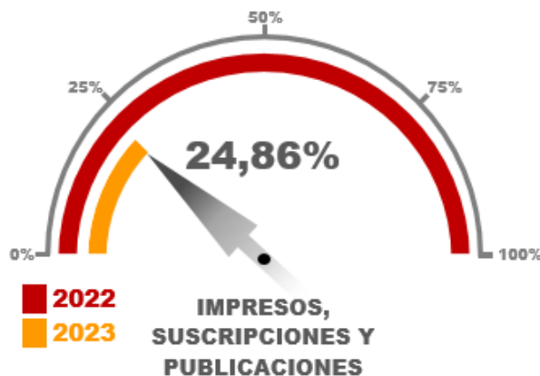
Gráfico No. 03

Para los Gastos denominados “Impresos, Suscripciones y Publicaciones”, se logró observar que el consumo fue relativamente bajo al corte del 30 de junio de 2023, pues el porcentaje esperado según la referencia era del 50% sobre la vigencia 2022 y se obtuvo solo el 24,86%.