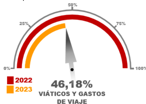
Gráfico No. 02

Para la descripción de este concepto, se detalló por grupos según se acumulan en el Reporte 025 los viáticos y gastos de viaje, en el mencionado corte se ha ejecutado 46,18% frente al valor total ejecutado en el año 2022.