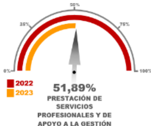
Gráfico No. 09

En el análisis del gasto por Prestación de Servicios Profesionales y de Apoyo a la Gestión, se detalló por grupos según se acumulan en el Reporte 025, en el que se observó que en general los gastos se han ejecutado en 51,89% al corte acumulativo del 30 de junio de 2023 frente al total del mismo concepto en la anterior vigencia 2022.