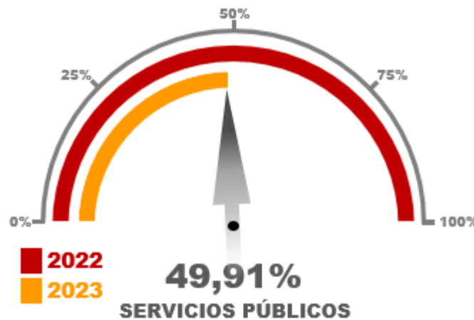
Gráfico No. 05

El ítem más representativo se denomina “Energía Eléctrica” por valor de novecientos ochenta y cuatro millones quinientos tres mil novecientos trece pesos M/c. ($ 984.503.913 COP) con variación porcentual de 57,26% frente al total gastado en 2022.