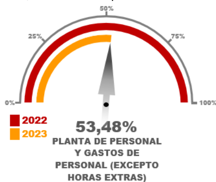
Gráfico No. 07