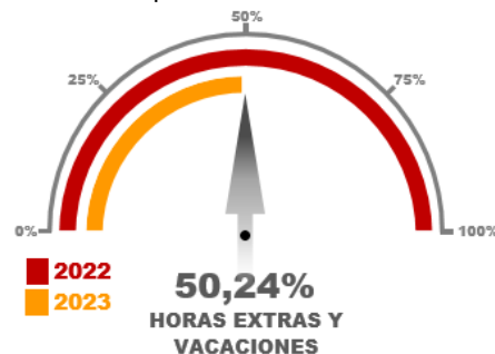
Gráfico No. 08