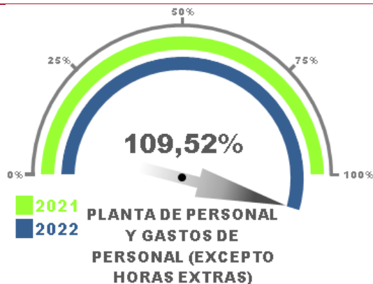
Gráfico No. 07