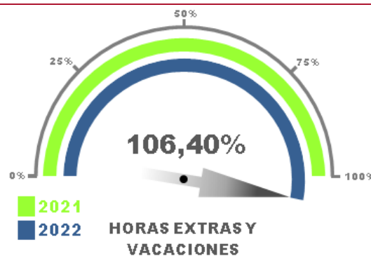
Gráfico No. 08