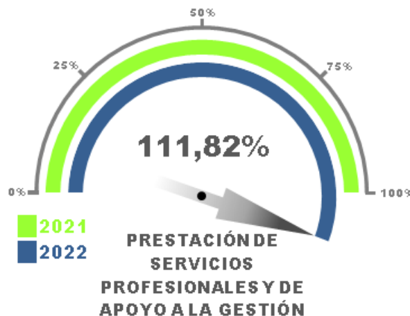
Gráfico No. 09

En el análisis del gasto por Prestación de Servicios Profesionales y de Apoyo a la Gestión, se detalló por grupos según se acumulan en el Reporte 025, en el que se observó que en general los gastos se han ejecutado en 111,82% al corte acumulativo del 31 de diciembre de 2022 frente al total del mismo concepto en la anterior vigencia 2021.