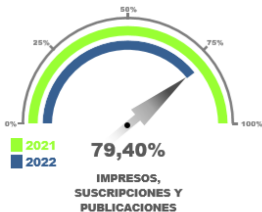
Tabla No. 03