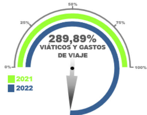
Gráfico No. 02

Para la descripción de este concepto, se detalló por grupos según se acumulan en el Reporte 025 los viáticos y gastos de viaje, en el mencionado corte se ha ejecutado 289,89% frente al valor total ejecutado en el año 2021.