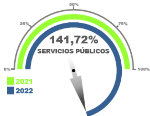
Gráfico No. 05

Los gastos por Servicios Públicos al 31 de diciembre de 2022 arrojan una variación porcentual de 141.72% comparado con el total gastado en toda la anterior vigencia 2021; los 41.72 puntos sobre la proporción de referencia esperada 100%, responden a la re-entrada en funcionamiento en las instalaciones de la Universidad.