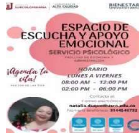
Ilustración 4. Tips psicológicos Vive Bienestar USCO.