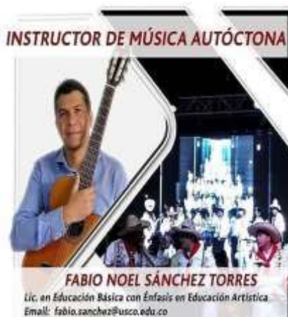
Ilustración 6. Taller "guitarra principiantes"

Los talleres de formación artística son la oportunidad que tienen los diferentes estamentos en el buen aprovechamiento del tiempo libre y el sano esparcimiento. Es así en este mes se orientaron 20 talleres de formación con todas las sedes, cumpliendo con el Syllabus desarrollado por cada uno de ellos.