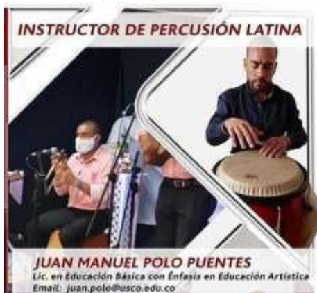
Ilustración 7. Taller "Percusión latinoamericana"