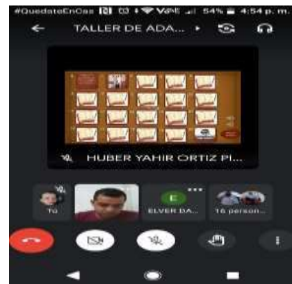
Ilustración 11. Talleres: Adaptabilidad Institucional

mismo y de los demás integrantes de la comunidad educativa, a través de su capacidad de relacionarse y comunicarse, el sentido de pertenencia y compromiso individual con la institución. La meta alcanzada a marzo fue de 41 actividades.