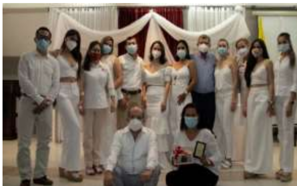
Ilustración 1. Gala de entrega de placas conmemorativas.

En acto conmemorativo se dio reconocimiento a maestros comprometidos con el desarrollo de