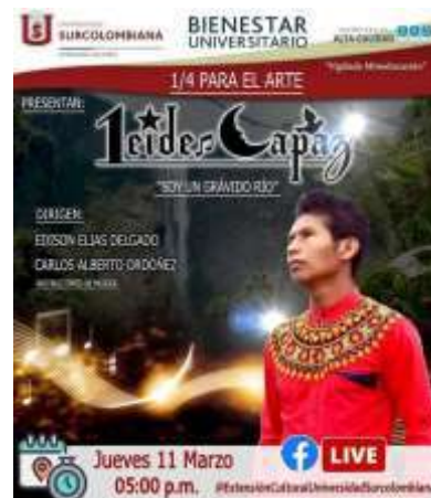
Ilustración 9. 1/4 para el Arte, tarde de Música