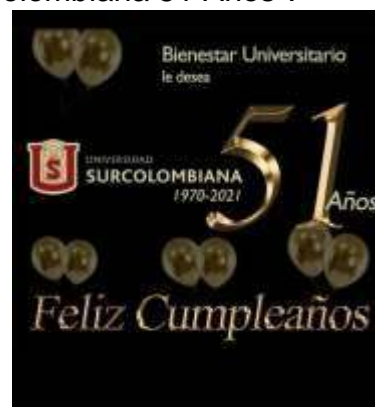
Ilustración 8. Celebración 51 años USCO