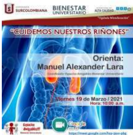
Ilustración 2. Actividad "Cuidemos Nuestros Riñones"