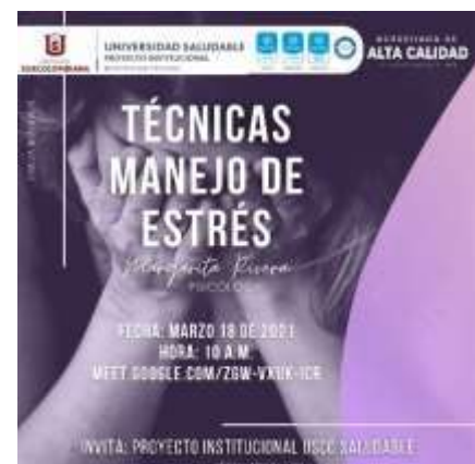
Ilustración 5. Taller Técnicas Manejo de Estrés.