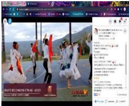
Ilustración 10. Presentaciones Culturales Sedes