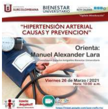
Ilustración 3: Actividad "Hipertensión arterial - causas y prevención"